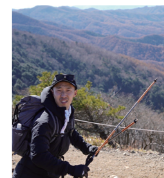
▲綺麗な景色と一緒に記念撮影!

仕事では、最近では遠方の学会にも行く機会も増え、多くの先生に現地でお会いできるようになりました。先生方には、弊社の機器をより良く使っていただきたいので、お手伝いできることがありましたら気軽に声がけくださいませ。皆様にお会いできる日を楽しみにしております。