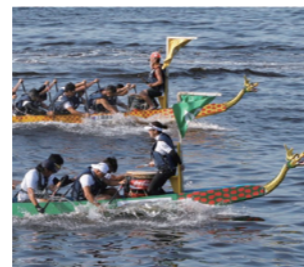
*写真は過去開催の様子

今年で30回目となるドラゴンボートレースは、毎年6月に行われる開港祭では見逃せないプログラムです。開港祭のマリンイベントとして、香港よりドラゴンボート6艇を横浜に移送し、第1回横浜ドラゴンボートレースを開催したのが始まりです。以来、本場香港のドラゴンボートレースへの参戦や香港から横浜のレースへの参戦など、同じ港湾都市として香港との交流が続いています。