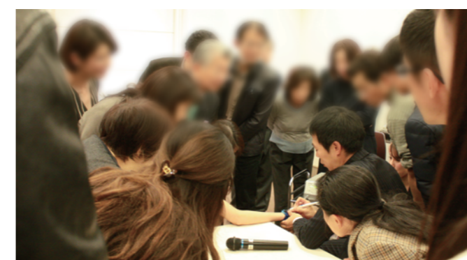
▲過去開催の様子(2017年)