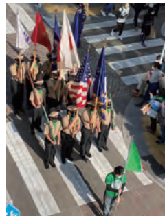
*写真は過去開催の様子

セントパトリックデーにちなんで、3月11日に横浜元町ショッピングストリートではアイリッシュミュージック&ダンス、そして個性溢れる各参加団体のパレードが観られます。