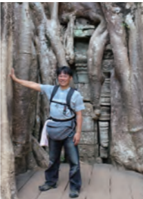
映画「トゥームレイダー」のロケ地、タ・ブROOM遺跡(カンボジア)にて▶

担当の先生方、新たに担当となる先生方、前職MR経験も活かし変化していく環境にお役に立てるよう努めて参ります。この浅黒い男と共に末永くよろしくお願ひもうしあげます。