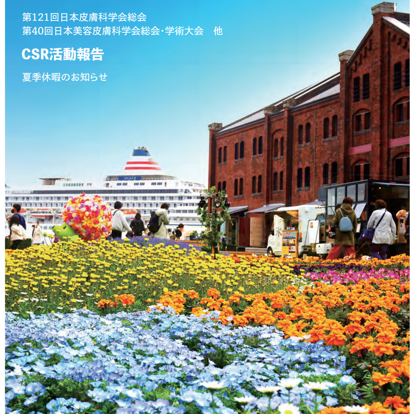
横浜赤レンガ倉庫「FLOWER GARDEN 2022」