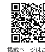
掲載ページはこちら