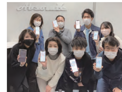
▲スマートフォンアプリで毎日歩数を計測!

アブソールでは、よこはまウォーキングポイントを活用した健康促進、時間休暇制度の導入、特定健診・がん検診の受診勧奨や健康情報の周知などを行っています。今後も、まずは従業員自身が心身ともに健康にいられるよう、そして、顧客様に質の高い仕事を提供できるよう、継続した健康経営を実践してまいります。