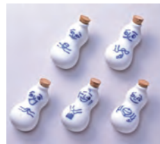
初代ひょうちゃん▲