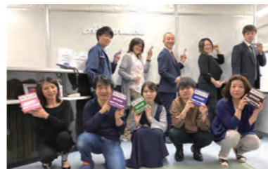
▲共同事業者賞の副賞として、ソイジョイ240本をいただきました!

「健康経営」とは、従業員の健康保持・増進の取り組みが企業の収益性を高める投資であることとらえ、従業員の健康づくりを経営的な視点から戦略的に実践する経営のことです。