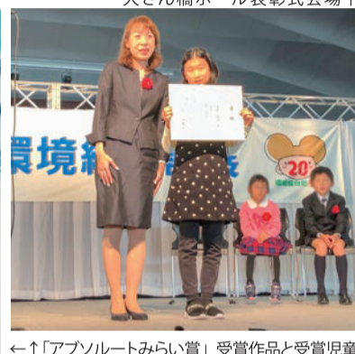
←「アブソルートみらい賞」受賞作品と受賞児童