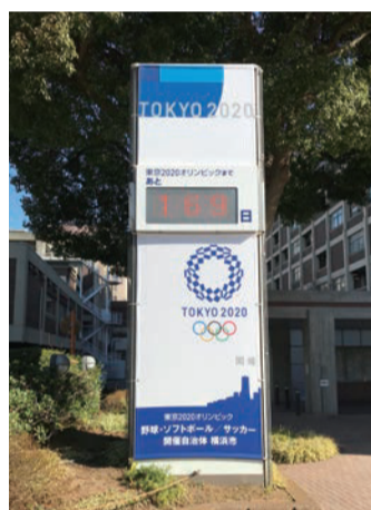
↑関内駅前に設置されたカウントボード

東京五輪の開幕まで200日となった1月6日、オリンピック・パラリンピック開幕までの日数を表示するカウントダウンボードが横浜市内に設置されました。同日、アブソルート横浜営業所のすぐそばにある横浜市庁舎の前で開催された記念セレモニーでは、林文子市長のあいさつや消防音楽隊による演奏、さらに、横浜スタジアムで開催される野球・ソフトボールの競技カラーである「藍色」で描かれたデイ・