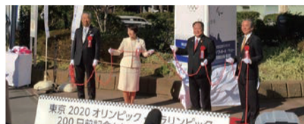
林市長らによる除幕式のセレモニー↑

カウントダウンボードの除幕式も行われました。横浜市内ではさらに、横浜国際総合競技場にてサッカーなど、あわせて37試合が開催される予定です。観戦チケットを入手された幸運な先生はいらっしゃいますか?開催が待ち遠しいですね。