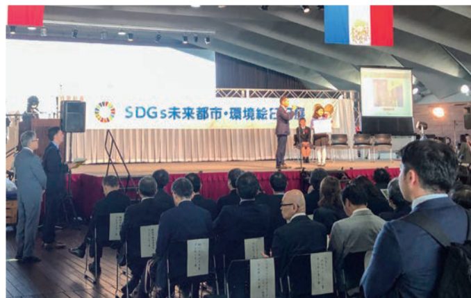
大さん橋ホール表彰式会場↑

食品廃棄問題・プラスチックごみ廃棄による海洋汚染など、今の世相を反映した作品が数多く見受けられました。環境絵日記は子どもたちから大人たちへ、そして未来へのメッセージです。これからもアブソルートは横浜の子どもたちと共に未来の街づくりの為に社会貢献を続けてまいります。