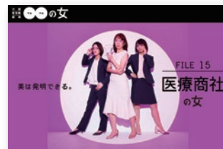
女性リーダー応援プロジェクト 『中間管理職 〇〇の女』 FILE15 “美は発見できる 一医療商社の女”

「女性がいきいきと働く」職場は、男性にとっても実力 を発揮しやすい職場でもあります。アブソルートは理想的 なワーク・ライフ・バランスにつながる職場での女性 活躍を推進してまいります。