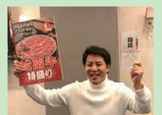
● 外回りのエネルギーは特盛り松阪牛で補充！(2020年冬・社内行事のビンゴゲームにて)

厳しい残暑が続いておりますので、皆様ご健康にはくれぐれもお気をつけてくださいますようお願い申し上げます。